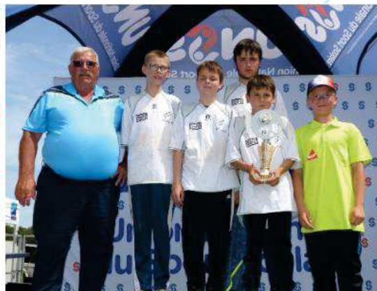
Collège René Cassin de Ernée