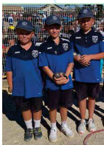
LAVAL P / ASPTT LAVAL