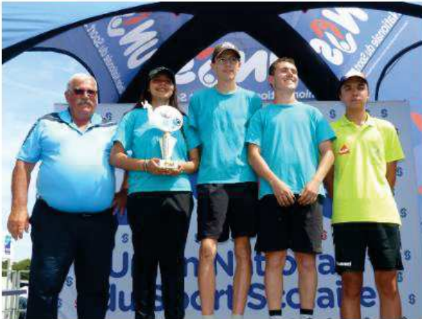
Lycée Douanier Rousseau de Laval