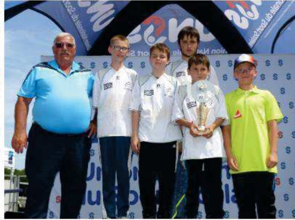
Collège René Cassin de Ernée

Le comité a prolongé la convention avec le Comité Départemental du Sport Adapté.