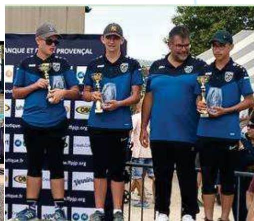
BONCHAMP / EVRON