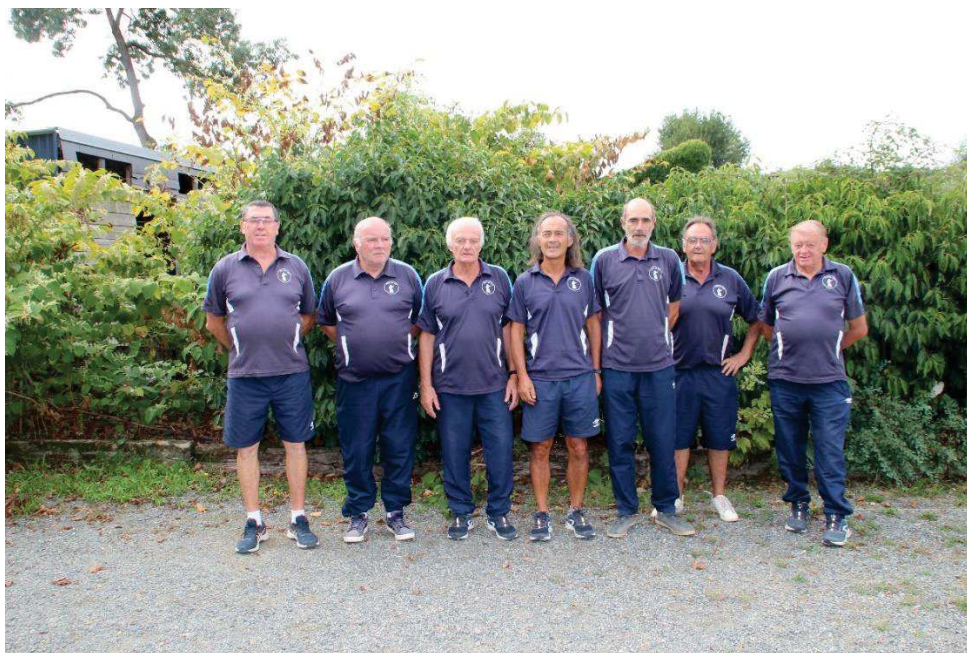
CHAMPION DU C.D.C. VETERANS 2022