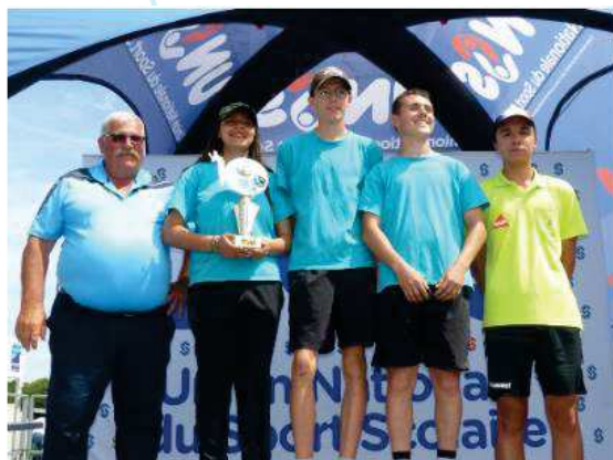
Lycée Douanier Rousseau de Laval

CHAMPION : Collège René Cassin d'Ernée dans la catégorie « Sport Partagé »